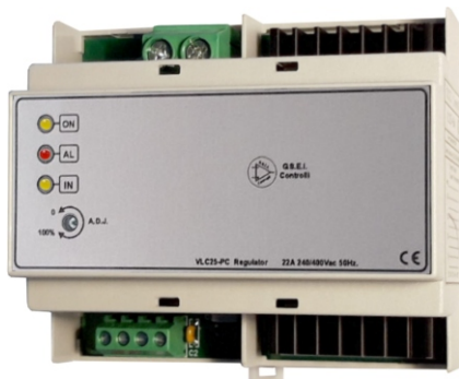
DIMENSIONI ( 6 Moduli ) L.105 P.70 H.90 Guida DIN

G.S.E.I. Controlli Elettronica Industriale